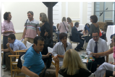
Στιγμές κοινωνικής δικτύωσης κατά την διάρκεια του διαλείμματος